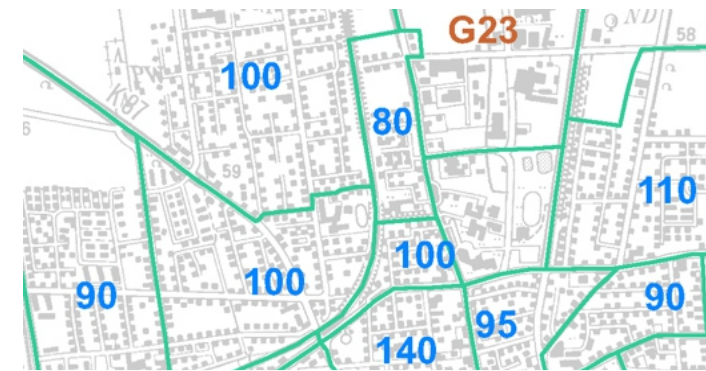
Grafische Darstellung der Bodenrichtwerte

Wichtigstes Element zur Herstellung allgemeiner Markttransparenz ist die jährliche Ermittlung von Bodenrichtwerten, die insbesondere als Grundlage für Wertermittlungen benutzt werden. Im Kreis Minden-Lübbecke werden vom Gutachterausschuss Bodenrichtwerte für Baulandflächen (Wohnbau- u. Gewerbenutzung) und für land- u. forstwirtschaftliche Flächen ermittelt. Die georeferenzierten Bodenrichtwerte werden in digitaler Form auf Grundlage der Geobasisdaten der Vermessungs- und Katasterverwaltung veröffentlicht. Der Bodenrichtwert ist der durchschnittliche Lagewert des Bodens für eine Mehrheit von Grundstücken innerhalb eines abgegrenzten Gebiets (Bodenrichtwertzone), die insbesondere nach Art und Maß der Nutzbarkeit weitgehend übereinstimmen und für die im Wesentlichen gleiche Wertverhältnisse vorliegen. Abweichungen eines einzelnen Grundstücks von dem Bodenrichtwertgrundstück hinsichtlich seiner Grundstücksmerkmale, zum Beispiel des Erschließungs- und Erschließungsbeitragszustands oder der Art und des Maßes der baulichen Nutzung, bewirken in der Regel entsprechende Abweichungen seines Wertes vom Bodenrichtwert.